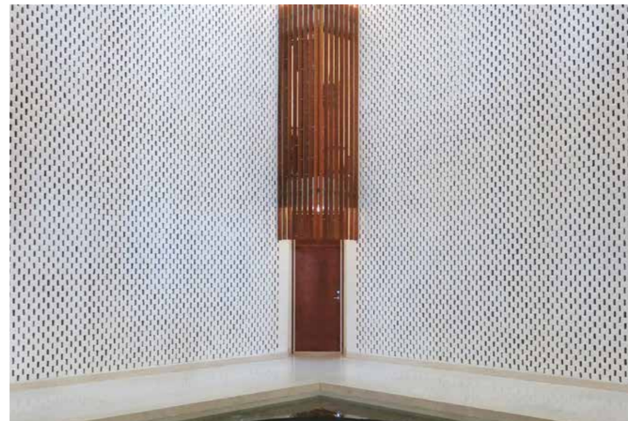
Den tidligere amerikanske ambassaden i Oslo har blitt rehabilitert og fått ny bruk. Detaljer i interiørene, som radiatorkasser, dører og vinduer har blitt istandsatt med høy faglig presisjon.

Hindringer for en god kobling mellom markedet og bedrift kan være at bestiller ikke vet hvilken kompetanse de har behov for. En annen utfordring kan være at en eier ikke finner fram til riktig bedrift eller at bedriftene ikke kjenner til markedet.