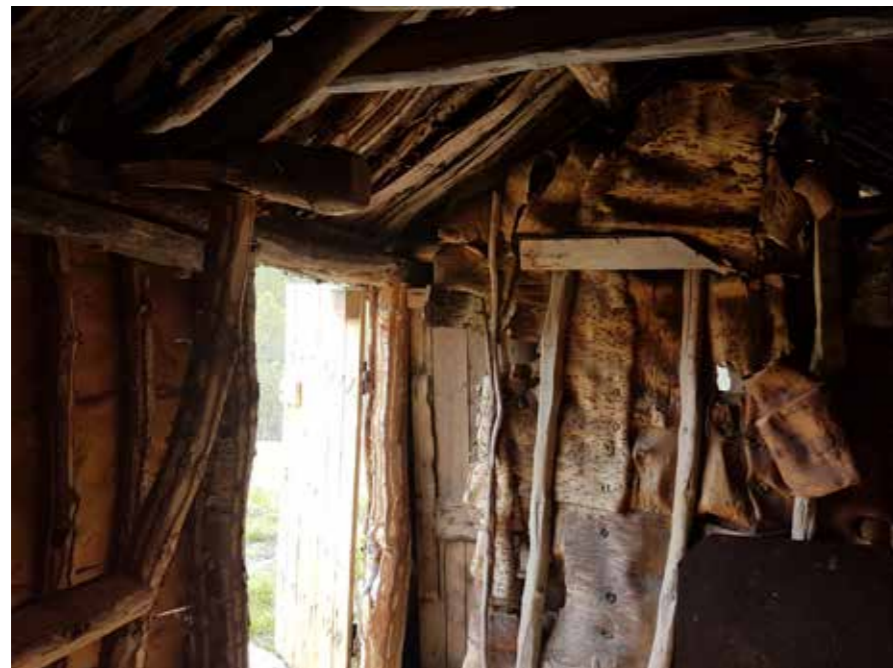
Kaperdalen i Senja: en av de best bevarte markesamslike boplassene i Norge. Det er stor håndverkmangel i Sápmi, noe som gjør det særlig utfordrende å ta vare på samiske kulturminner.

Tilskuddsmidlene er blant kulturmiljøforvaltningens viktigste virkemidler. En vesentlig del av bygnings- og fartøyvernet er arbeid på fredete og verneverdige kulturminner hvor eiere og forvaltere mottar offentlige tilskudd til istandsetting, vedlikehold og sikring. Tilskuddsordningene gir mulighet for å stille vilkår om antikvarisk og håndverksfaglig utførelse og kompetanse.