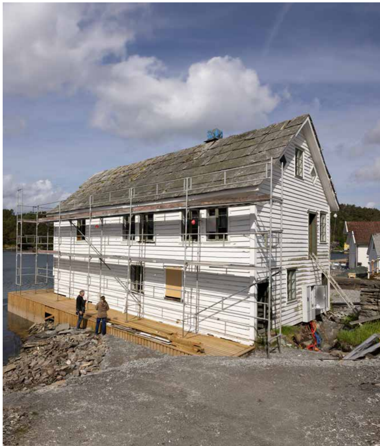
Sjøhuset Vatna i Sveio kommune skal settes i stand etter å ha stått tomt i over 20 år. Skifertaket og vinduene står på listen over tiltak som skal gjennomføres, slik at bygningen kan få bruk som forsamlingshus.