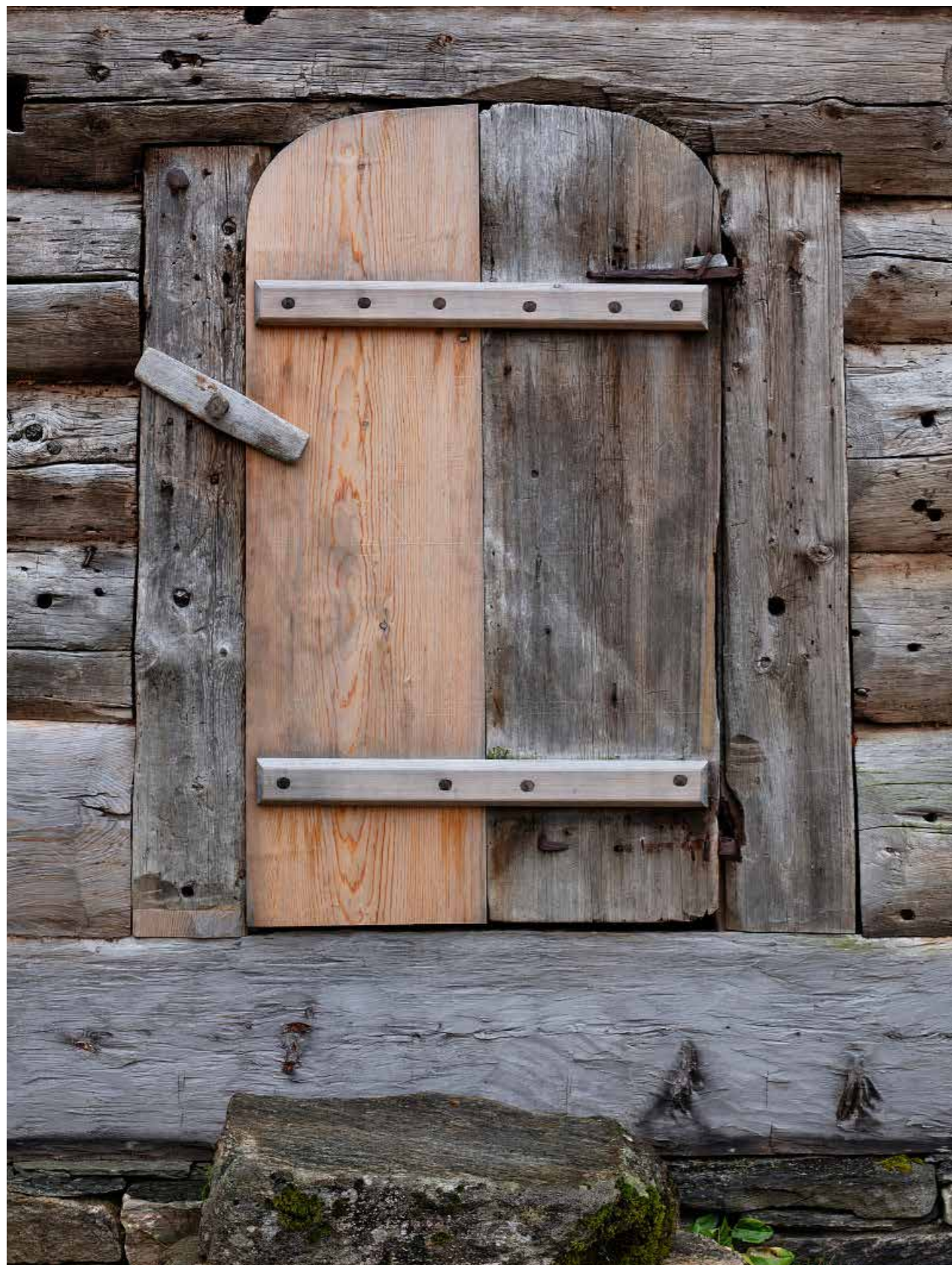
Den gamle røykstua Toskedalstova i Vestland ble demontert på 1960-tallet og lagret på en låve i mange år. Dendrokronologiske undersøkelser har vist at bygningen har bygningsdeler fra rundt 1596. I 2018 ble stua satt opp igjen på gården. De bygningsdelene som det ikke var mulig å bruke på nytt, ble erstattet med kopier utført i samme materialkvalitet og håndverksteknikker, med fokus på lokale materialer.