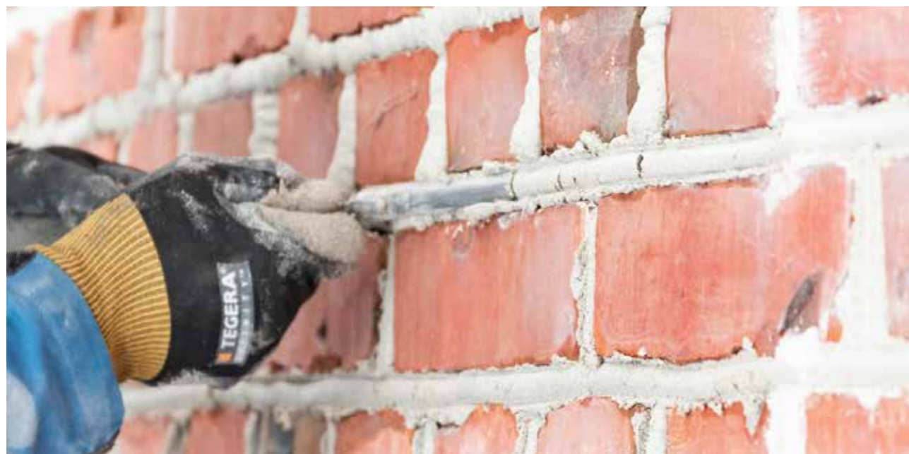
Riktig materialbruk er viktig for en god istandsetting. Her blir fuger i sementmørtel erstattet med nye pøsefuger i kalkmørtel.

Riksantikvaren er klar over at mange mindre bedrifter har begrensede ressurser til å administrere omfattende anskaffelsesprosesser i konkurranser om offentlige midler. Oppdragsgiversiden kan også ha begrensede kunnskaper om anskaffelsesregelverket. I sum kan dette gjøre at offentlige anskaffelser blir en barriere for å nå målsettingene i strategien.