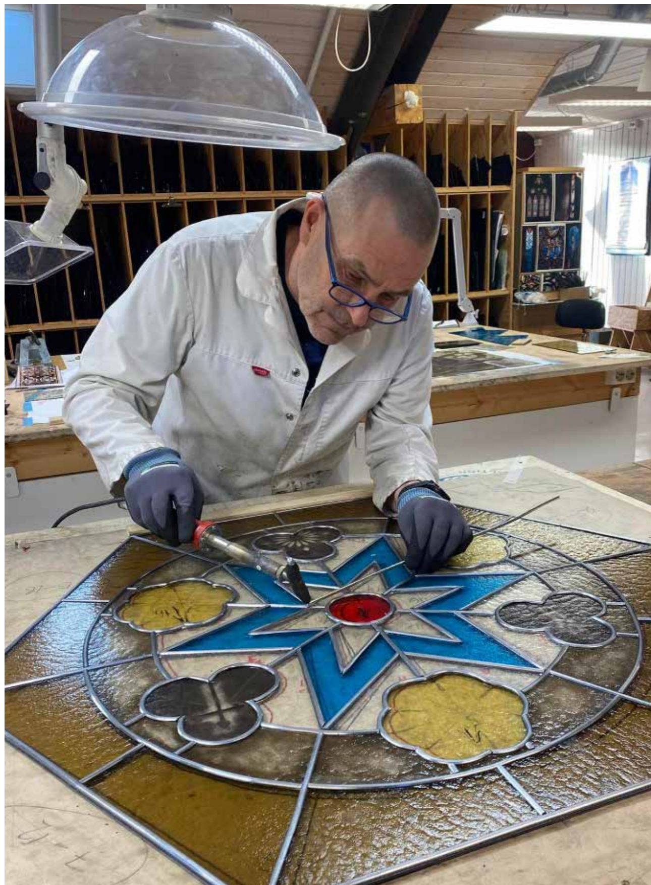
For å ivareta kulturminner og kulturmiljø er det behov innenfor både allmenne og spesialiserte håndverksfag. Ved Nidaros Domkirkes Restaureringsarbeider (NDR) holdes håndverkstradisjonene i hevd, og opplæring og utdanning er en viktig del av arbeidet. I dag kombinerer de intern videreutdanning med bacheorutdanning i teknisk bygningsvern ved NTNU.